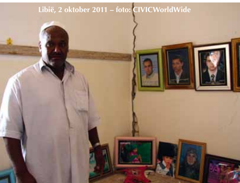
Libië, 2 oktober 2011