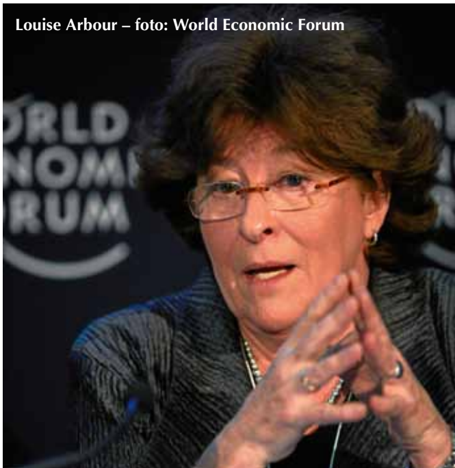
Louise Arbour