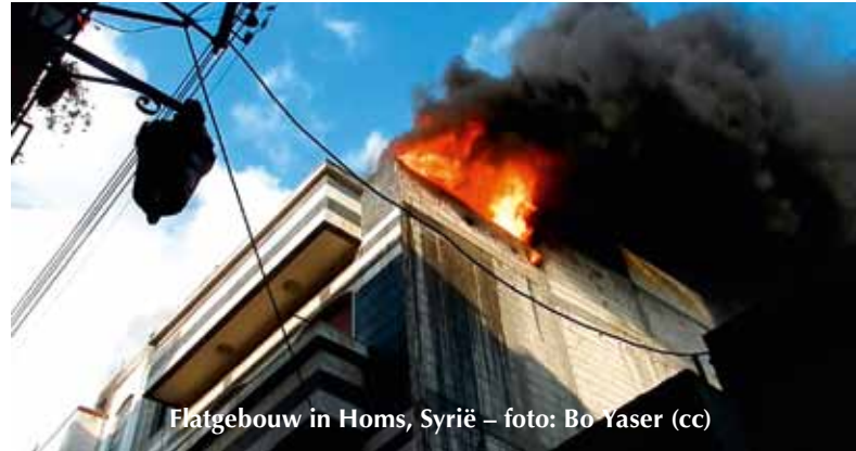
Flatgebouw in Homs, Syrië

Tenslotte is er de VN-aanpak met o.a. de bemiddeling van Kofi Annan en het zes-puntenplan, inclusief militaire waarnemers voor het monitoren van de naleving van het staakt-het-vuren en een commissie die ter plaatse het Houla-bloedbad onderzoekt. De VN-benadering is moeilijk, maar is het meest belovend. Ze verdient meer daadwerkelijke steun van binnen- en buitenlandse partijen. Aan alle geweld moet een einde worden gesteld. Alleen inclusieve vredesonderhandelingen die ruimte bieden voor de bredere vreedzame oppositie en niet alleen voor de Syrische Nationale Raad (vooral gesteund door de Verenigde Staten en Europa) hebben kans op slagen. Het heeft bovendien ook geen zin om Iran als de enige buitenlandse spelbreker in Syrië op te voeren, zoals gebeurde in de International Herald Tribune en The Economist. Dit getuigt niet van gesofisticeerde diplomatieke correspondentie.