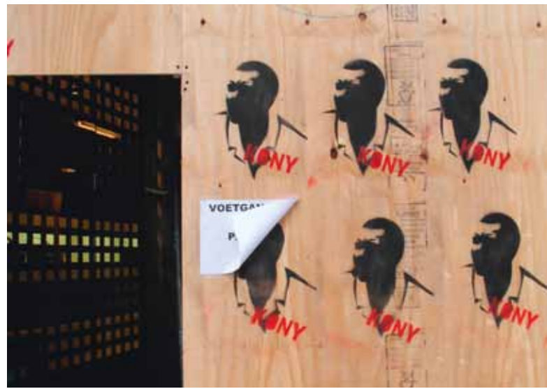
Het supermiddel voor gerechtigheid bestaat niet (Joseph Kony 2012, nog altijd gezocht door de Strafhof in Den Haag).

Als reactie op deze problemen met de juridische aanpak experimenteert men hier en daar met rituelen die tot het culturele erfgoed van de betrokken samenlevingen behoren. Ook de formule van een waarheidscommissie is een weg die voor korte of lange tijd terecht voorrang kan krijgen. Tegelijkertijd bieden deze alternatieven de mogelijkheid